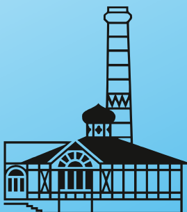
STADTMUSEUM in der Beschußanstalt